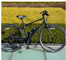
スマチャリ搭載自転車