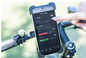
スマチャリアプリ