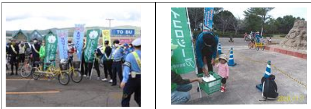
統一事業(北見バイコロジー)

コロナ感染の予防措置のため、地域の状況に合わせて7のバイコロジー地方組織が統一活動として交通ルールの遵守と自転車乗用マナーの向上を訴えるキャンペーン活動を実施し、バイコロジーの普及啓発を図った。また、2020年6月30日に道路交通法が一部改正され、自転車の妨害行為に対して厳しい罰則が義務づけられたが、あまり認知されていない現状を受け、バイコロジーの目的の「正しい自転車利用の啓発」を行うため、改正された道路交通法と自転車ルール・マナー遵守を呼び掛けるポスターを作成し自転車販売店やバイコロジー各地方組織の関係する公共施設に掲示を依頼して周知を行い、安全利用の向上を図った。