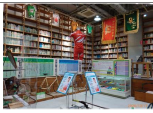
自転車文化センターライブラリー展示室・専門図書

また、一般の方の自転車への興味を喚起し、これから自転車に乗ろうとする方々へ向けた、当センターオリジナル「BCCサイクリングコース推奨ブック①～始めよう自転車ライフ～」を作成し、当センターwebにて紹介するとともに、来館者やサイクリング講座などの講習会にて配布・活用した。