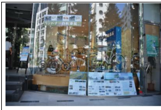
自転車文化センターギャラリー正面