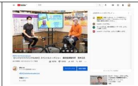
YouTubeにてオンライン スペシャルトークショーを行った