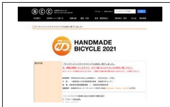
オンラインハンドメイド特設サイト

※参考 昨年の来場者数 合計 3,550 人 (25日 2,183 人 / 26日 1,367 人)