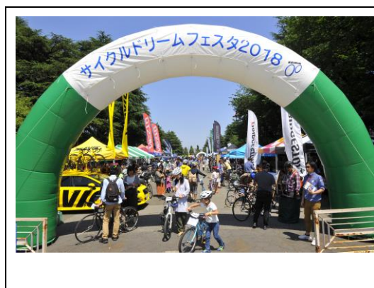
「サイクルドリームフェスタ2018」 入り口