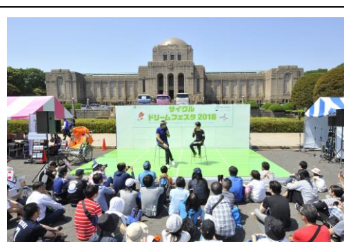
「サイクルドリームフェスタ2018」 会場の様子