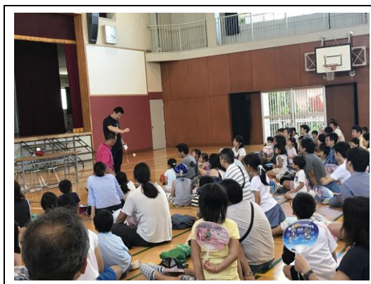
自転車安全利用講習会 (川崎市幸区 PTA 協議会)