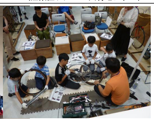
自転車の分解 (夏休み自転車教室)

また、自転車の楽しみや魅力を伝えることを目指し、夏休みと春休みの期間中に一般の人が参加・体験でき、特に夏休みの期間については、自由研究の課題にも活用できる教室を開催した。併せて自転車の正しい乗り方についての安全利用講習も行った。