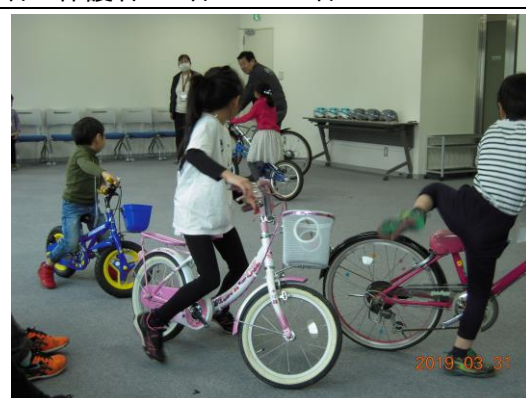
春休み自転車教室 「自転車乗り方教室」