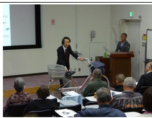
自転車交通安全講習会 (江東区シルバー人材センター)