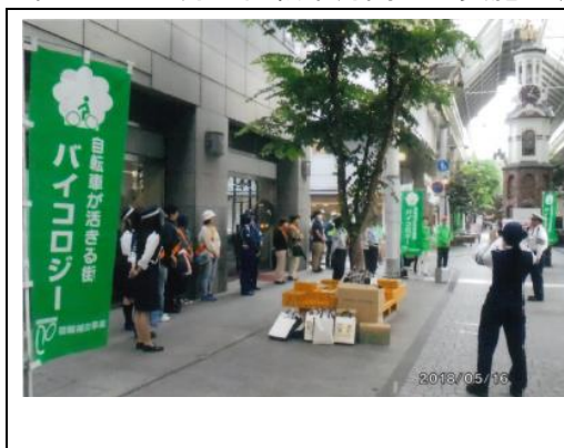
統一事業(和歌山バイコロジー)

バイコロジー運動の推進を図るため、バイコロジーをすすめる会地方組織とともに事業を実施した他、バイコロジー地方組織の統一活動として交通ルールの遵守と自転車乗用マナーの向上を訴えるキャンペーン活動を春・秋の全国交通安全運動期間中および5月の自転車月間にて実施し、バイコロジーの全国的な普及啓発を図った。