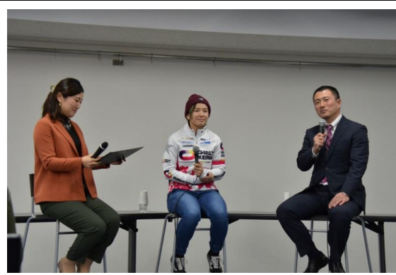
ガールズケイリン選手・元競輪選手による スペシャルトークショー