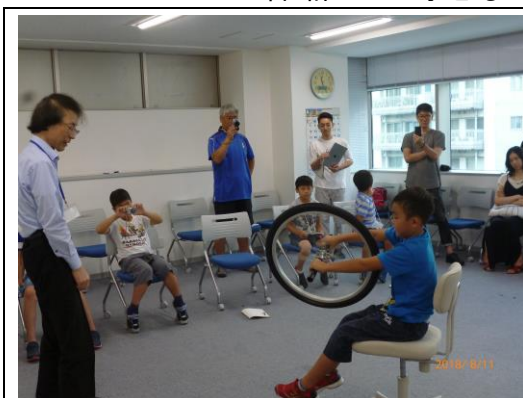
夏休み自転車教室 「自転車は何故倒れないのか？」