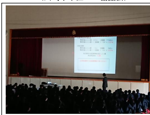
自転車交通安全教室 (埼玉県立和光高等学校)