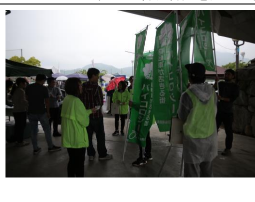
統一事業(香川バイコロジー)