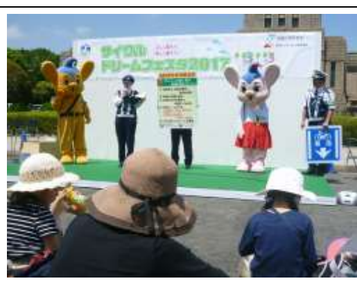
「サイクルドリームフェスタ2017」 会場の様子