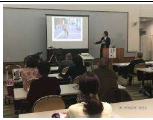
自転車交通安全講習会 (東京しごと財団)