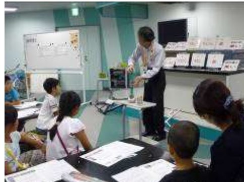
夏休み自転車教室 「自転車は何故倒れないのか?」