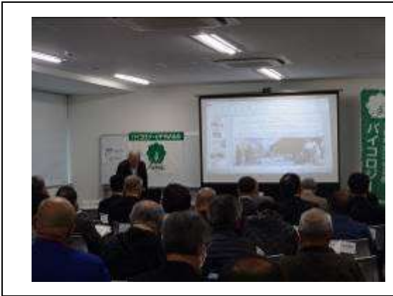
18組織21名、一般22名他関係団体13名

自転車を安心して乗ることができる環境づくりや今後の自転車のあり方を検討し、自転車市民権運動の活発化を図るため、バイコロジー地方組織の地域ごとに講師を招聘し、バイコロジー運動のリーダー育成を目的としたセミナーを開催した。