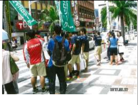
統一(沖縄バイコロジー)