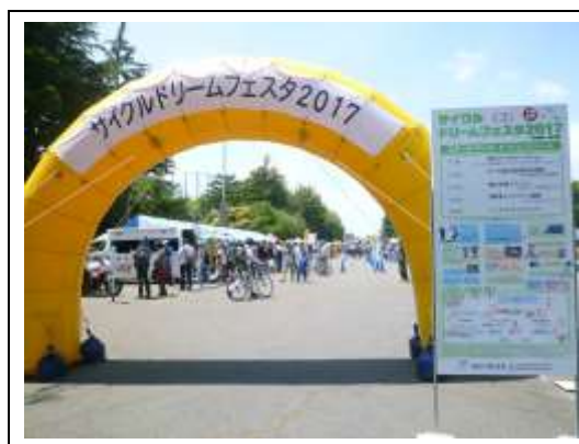
「サイクルドリームフェスタ2017」 入り口