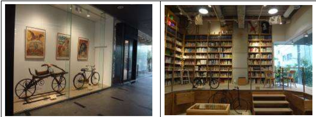
自転車文化センターライブラリー正面

自転車の総合情報提供施設である「自転車文化センターライブラリー」を運営した。 (来場者数 6,367名)