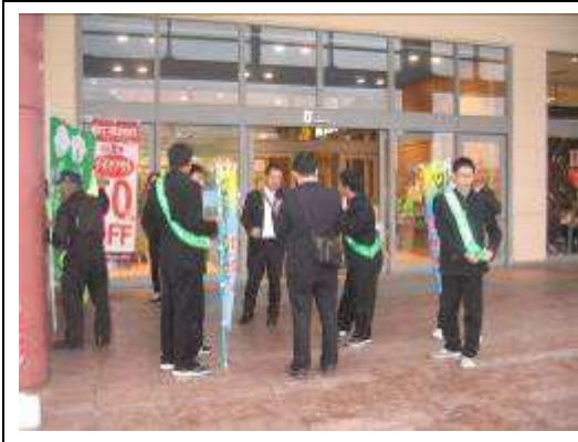
統一(岐阜バイコロジー)

バイコロジー運動の推進を図るため、バイコロジーをすすめる会地方組織とともに事業を実施した他、バイコロジー地方組織の統一活動として交通ルールの遵守と自転車乗用マナーの向上を訴えるキャンペーン活動を春・秋の全国交通安全運動期間中および5月の自転車月間にて実施し、バイコロジーの全国的な普及啓発を図った。