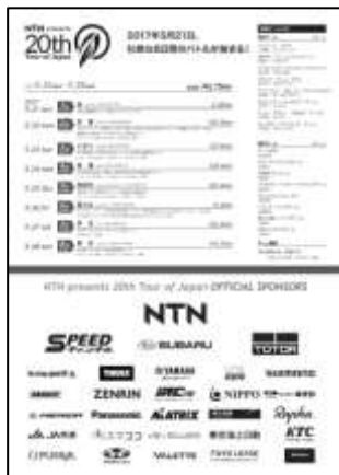
チラシ (表面)、ポスター