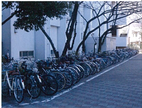
自転車駐輪場(1 学年用)平置き