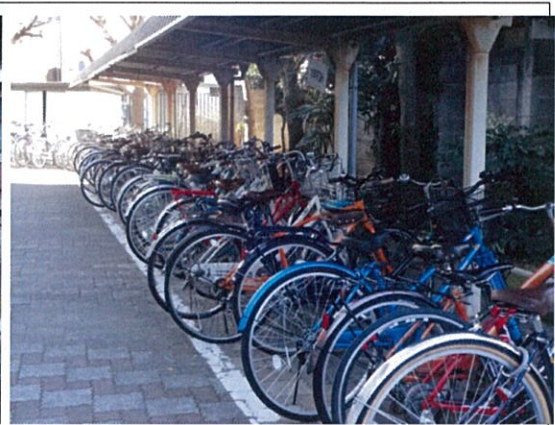
自転車駐輪場(2 学年用)