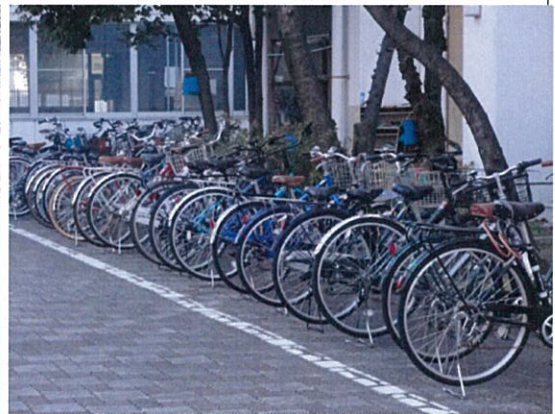
自転車駐輪場(2 学年用)平置き