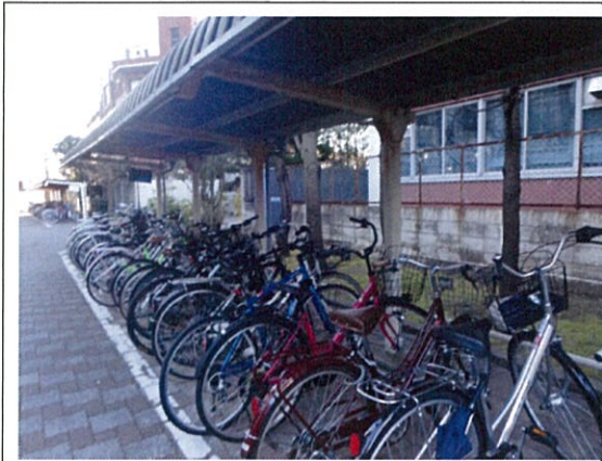
自転車駐輪場(1 学年用)