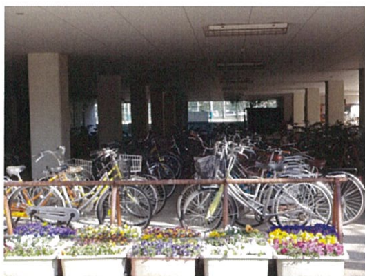
自転車駐輪場(手前側)

因みに、同校では、教諭による自転車通学の指導は、特に行われていなかったが、交通安全啓発の一環として、年に1回、自転車安全教室を開催しているとのことである。