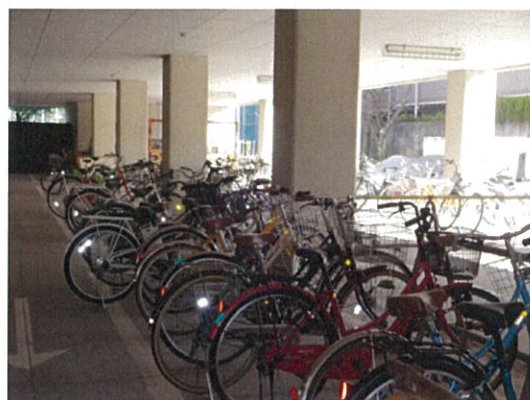
自転車駐輪場(内部)