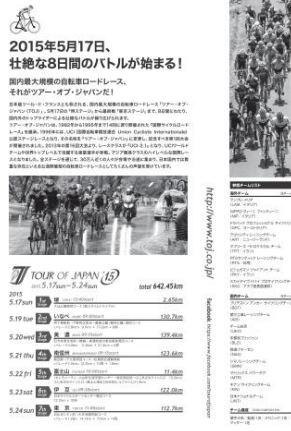
チラシ (表面)、ポスター チラシ (裏面)