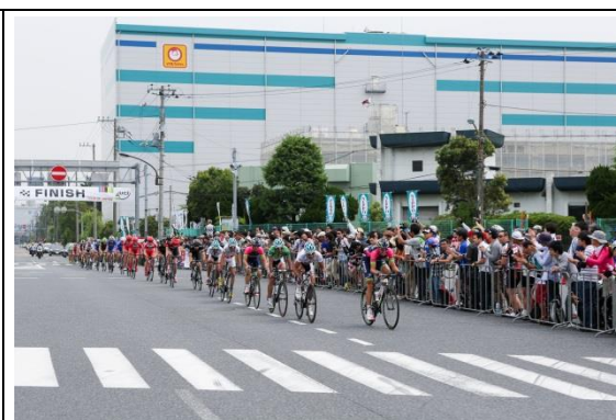
多くの観戦者がいる、東京ステージフィニッシュ地点を通過する選手。