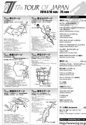
チラシ（表面）、ポスター