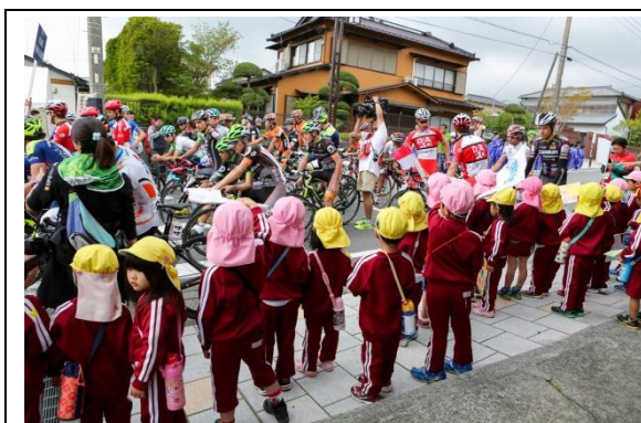
子どもたちの声援に応えながら富士山ステージのスタートを待つ選手たち。

国内で唯一の都府県(堺~東京間)をまたぐステージレースである、国際自転車競技連合(UCI)公認の自転車ロードレース「第17回ツアー・オブ・ジャパン」を開催した。6ステージ全て公道を使用したコース設定であり、UCIのレースクラスが2.1にランクアップしたことにより、一般市民や国内外のマスコミからの注目度が高い大会となった。