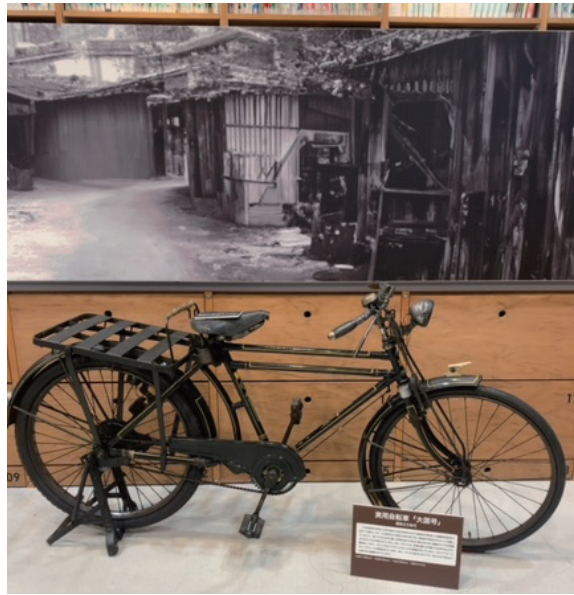
●ライブラリー・車両展示・パネル展示