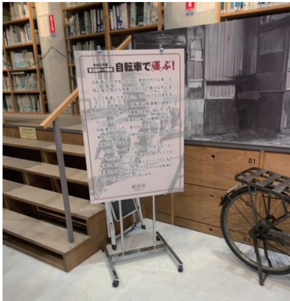
●ライブラリー・パネル展示