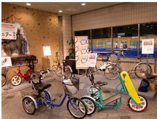
▼7台の自転車の展示を行った