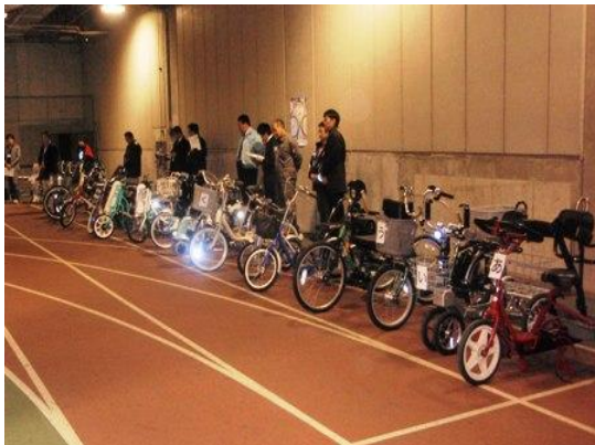
▼約20台の試乗車が用意され、モニターの方々に試乗いただきました

開催日時 : 展示会 平成22年11月22日(月)～25日(木) 試乗会 平成22年11月25日(木) 9:30～14:30 (付帯イベント) ミニディスカッション 15:00～ 開催場所 : 障害者スポーツ文化センター 横浜ラポール