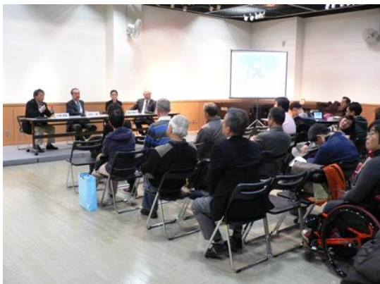
▼試乗会終了後のディスカッション風景