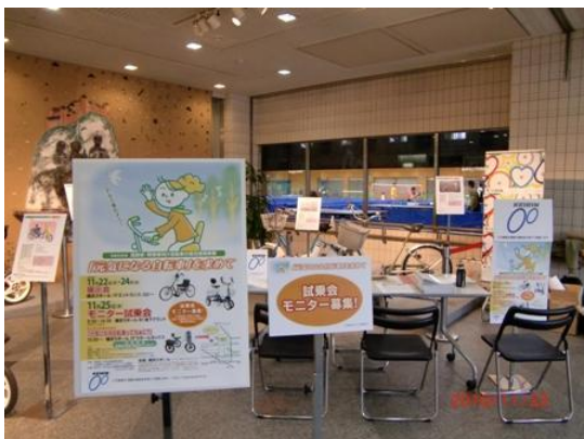
▼22～25日に実施した展示会の様子 横浜ラポールにお越しの多くの方々にご覧 いただきました