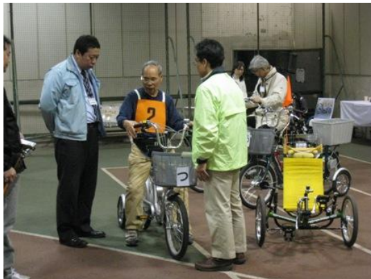
▼担当者から自転車の乗り方、特性などを説明し、安全に試乗いただきました